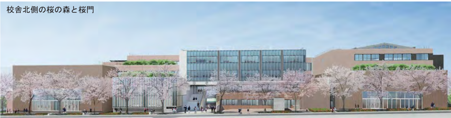
校舎北側の桜の森と桜門