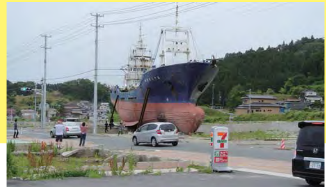
市内の鹿折(ししおり)地区に打ち上げられた漁船。2012年7月撮影その後、市民アンケートの結果を受け、2013年秋に撤去された。

業の地区を対象に、地区計画の手続きを進めていますが、説明会などで出される質問は、地区計画に関するのではなく、「いつ土地の引き渡しを受けられるか」ということばかりです。