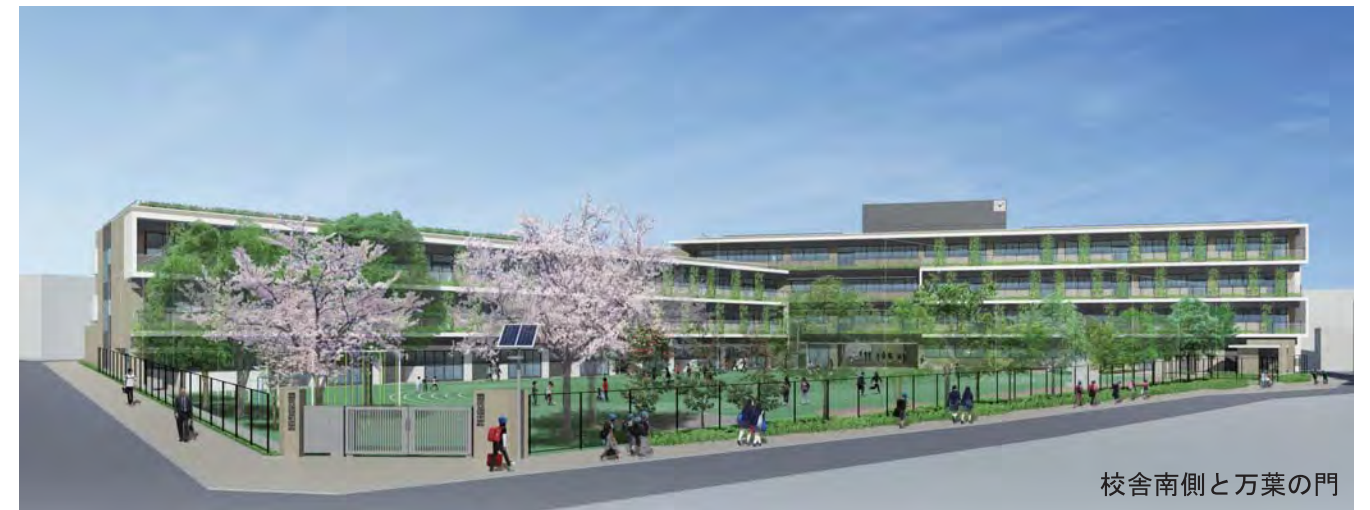
校舎南側と万葉の門

●道路に面して歩道状空地や小広場を設け、歩きやすい道路とし、避難もしやすくしています。