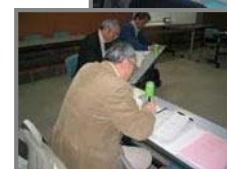
▲ワークショップのようすと結果